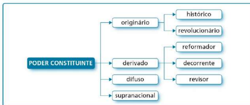
Imagem extraída da obra: Lenza, Pedro. Direito Constitucional esquematizado /Pedro Lenza. – Coleção esquematizado®/coordenador Pedro Lenza – 24. ed. – São Paulo: Saraiva Educação, 2020, p. 153.

Certo, mas essas divisões podem ter causado uma confusão na sua cabeça. Por isso, para facilitar a sua compreensão, recomendamos que dedique alguns minutos analisando o organograma abaixo: